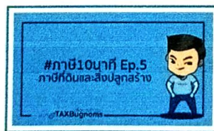
ภาษีที่ดินและสิ่งปลูกสร้าง