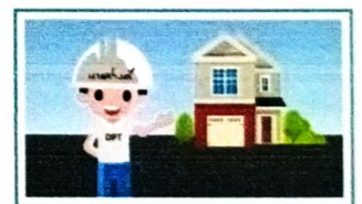
การยื่นขออนุญาตก่อสร้าง