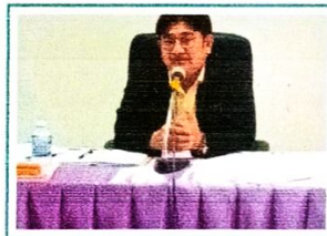
ประชุมคณะกรรมการพัฒนาองค์การบริหารส่วน...