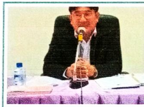
ประชุมเครือข่ายธรรมภิบาลบ้านเมืองที่...