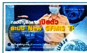
กรมบัญชีกลางเปิดตัวระบบ New GFMS