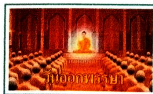
ประวัติความเป็นมา วันออกพรรษา