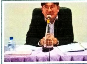
ประชุมเครือข่ายธรรมภิบาลบ้านเมืองที่...