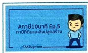
ภาษีที่ดินและสิ่งปลูกสร้าง