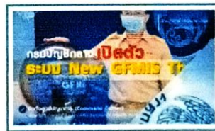
กรมบัญชีกลางเปิดตัวระบบ New GFMS