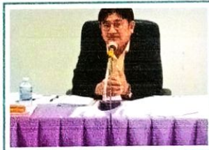
ประชุมคณะกรรมการพัฒนาองค์การบริหารส่วน...