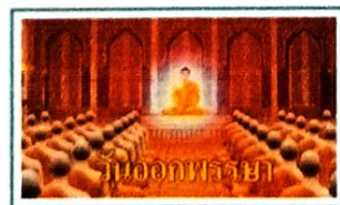
ประวัติความเป็นมา วันออกพรรษา