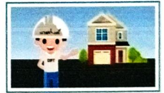
การยื่นขออนุญาตก่อสร้าง